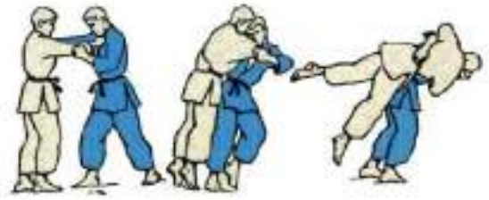
2. Стегно з захватом за пояс на спині Tsurigoshi