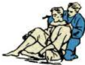
3. Удушення плечем і передпліччям збоку Naclaka-Jime