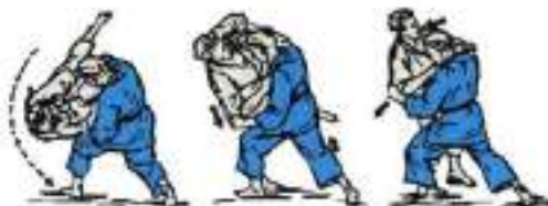
7. Виведення з рівноваги Sumi-Otoshi