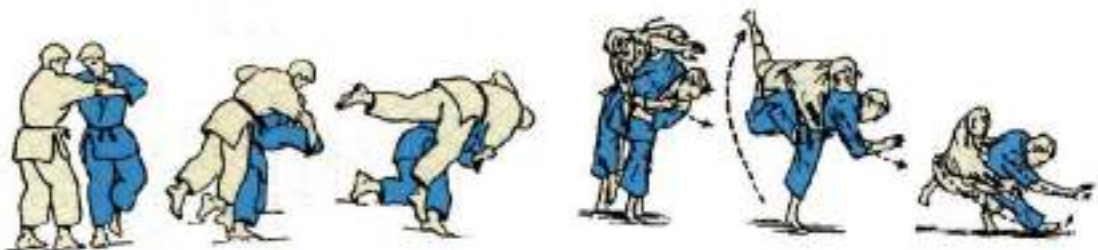
2. Через плече з коліна Seoi-Otoshi