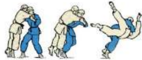
4. Через стегно захопленням тулуба Uke-Goshi