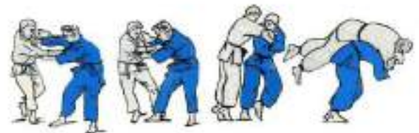
6. Ko-Soto-Gari Seoi-Nage