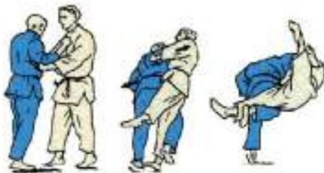
5. Підхоплення O-Soto-Gari