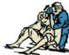
2. Удушення ричагом ззаду Ushiro-Jime