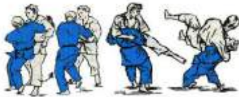
3. O-Goshi Ura-Nage