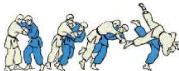
8. Підхват із середини Uchi-Mata