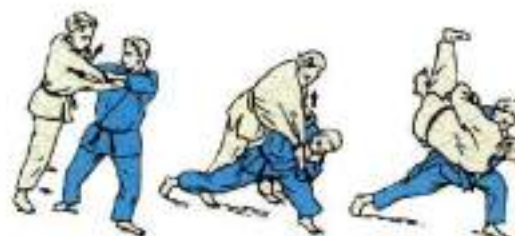
6. Передня підніжка Tai-Otoshi