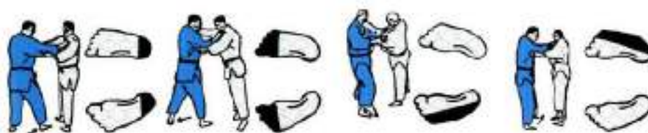
5. Виведення з рівноваги.

Поштовхом: на п'яти, ривком до себе на пальці ніг; в боки: вліво, вправо