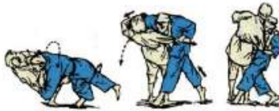
1. Задня підніжка з падінням Tani-Otoshi