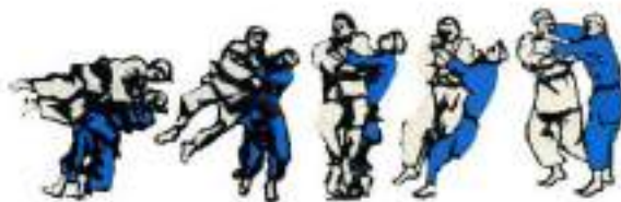
5. Ashi-Guruma Utsuri-Goshi