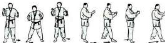
2. Пересування: приставними кроками в боки, вперед, назад