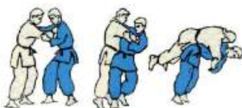
3. Через стегно з захватом коміру Koshi-Guruma