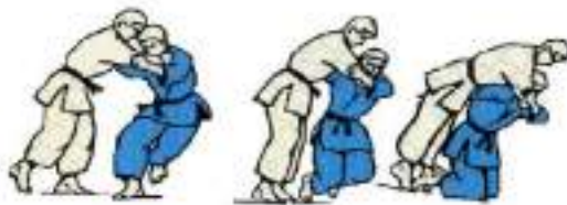
3. Через плече з колін Seoi-Otoshi