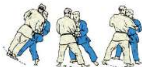
5. Підсічка в темп кроків Okuri-Ashi-Barai