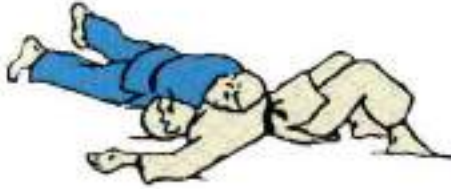
1. Утримання збоку з захопленням з під руки Kuzuri-Keza-Gatame