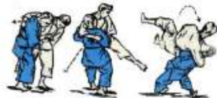
6. Прогібом через груди Ura-Nage