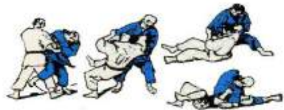
4. Ashi-Curuma Keza-Gatame