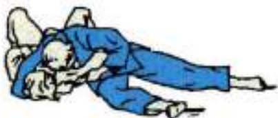
1. Утримання збоку Hon-Keza-Gatame