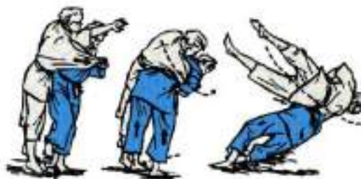
6. Через спину захопленням руки під плече Soto-Maki-Komi