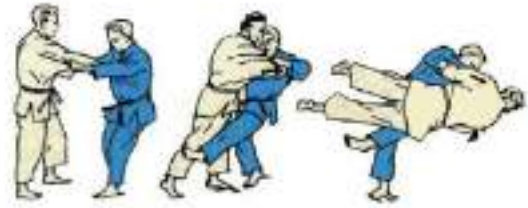
2. Підсічка в коліно Hiza-Guruma