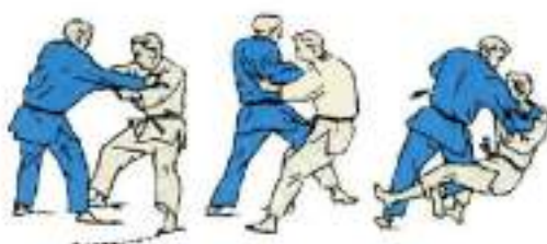
1. Зачеп із середини O-Uchi-Gari