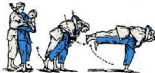
4. Через ногу скручуванням O-Guruma