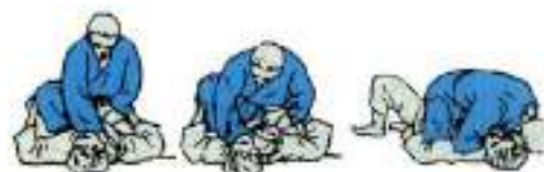
6. Удушення передпліччям захватом вилоги Kata-Juji-Jime