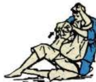
4. Удушення вилогом і важелем з під руки Kata-Ha-Jime