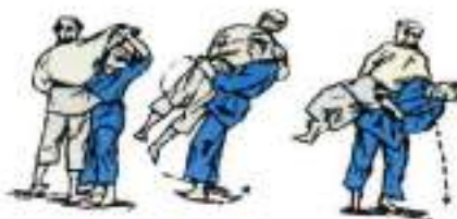
5. Зворотнє стегно захоплення тулуба Utsuri-Goshi