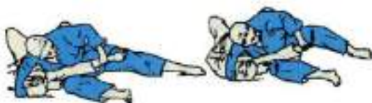
5. Ричаг ліктя через стегно Keza-Ucle-Hishigi-Gatame