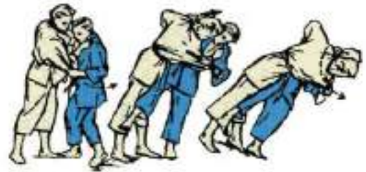
4. Бокова підніжка Ashi-Guruma