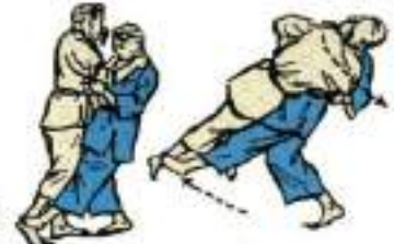
6. Передня підсічка під відставлену ногу Hari-Tsurai-Komi-Ashi