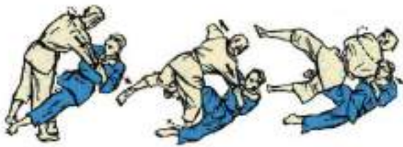
3. Бокова підніжка з падінням Yoko-Otoshi