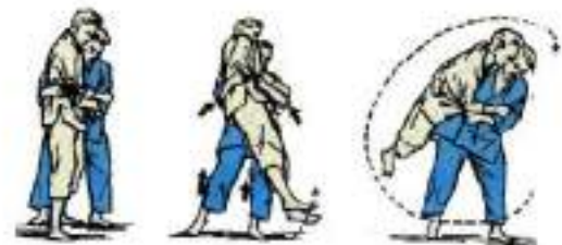
5. Зворотний через стегно Ushiro-Goshi