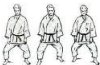
1. Сійка: фронтальна, права, ліва