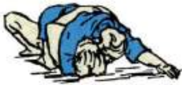
3. Утримання верхи захопленням руки Kuzure-Tate-Shiho-Gatame