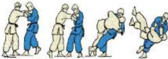
3. Передня підсічка Sasae-Tsuri-Komi-Ashi