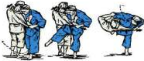
1. Задній вихват під дві ноги O-Soto Guruma