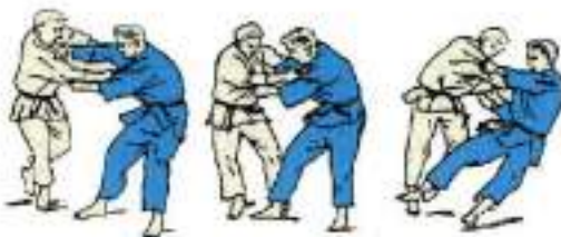
7. Задня підсічка Ko-Soto-Gari