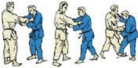
1. Бокова підсічка De-Ashi-Barai