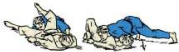
4. Утримання поперек захопленням дальньої руки Kuzure-Yoko-Shiho-Gatame