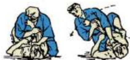
6. Важиль ліктя з допомогою ніг Ude-Hishiqi-Gatame