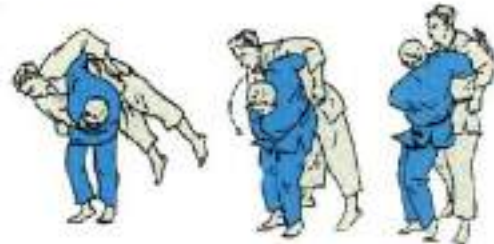
6. Через стегно O-Goshi