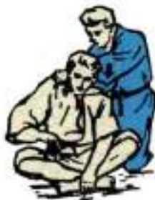
5. Удушення схрещеними передпліччями збоку Guaku-Juji-Jime