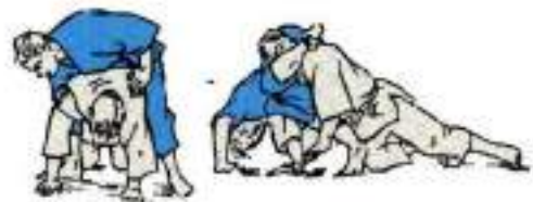
6. Перегіб ліктя захопленням руки між ніг-перевертанням Ude-Hishigi