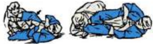
2. Перегіб ліктя важелем ноги зверху Ude-Hishigi-Gatame