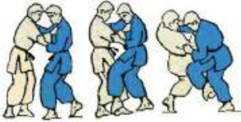
1. Зачеп зовні Ko-Soto Gake