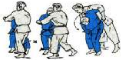
1. Ko-Soto-Gari O-Goshi