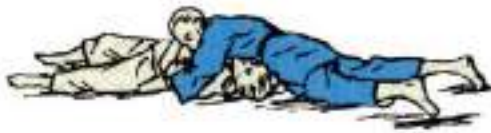
5. Утримання з боку голови захопленням дальньої руки Kuzure-Kami-Shiho-Gatame