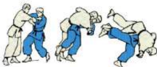
7. Підхват під дві ноги Harai-Goshi