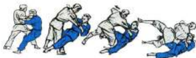
7. O-Uchi-Gari Yoko-Otoshi