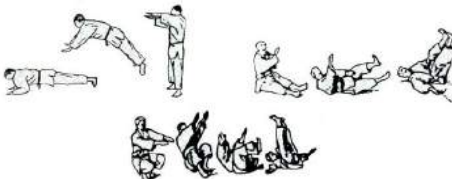
4. Падіння на живіт, на боки, на спину