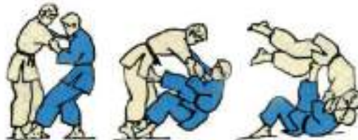
7. Через голову Tomoe Nage