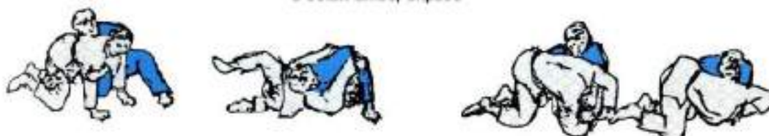
6. Перевертання: за руку та ногу, за руки

Поштовхом: на п'яти, ривком до себе на пальці ніг; в боки: вліво, вправо