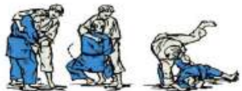
4. Скручуванням через груди Yoko-Guruma