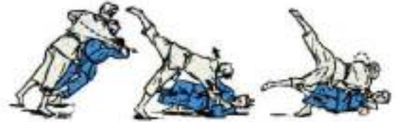
2. Передня підніжка з падінням Uki-Waza