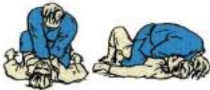
1. Удушення спереду схрещеними руками Nami-Juji-Jime