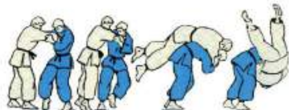
8. Через плече Seoi-Nage