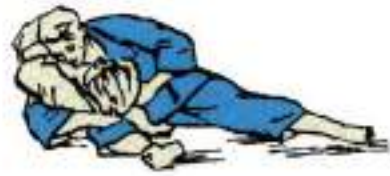
2. Утримання збоку з захопленням своєї ноги Makura-Tate-Shino-Gatame