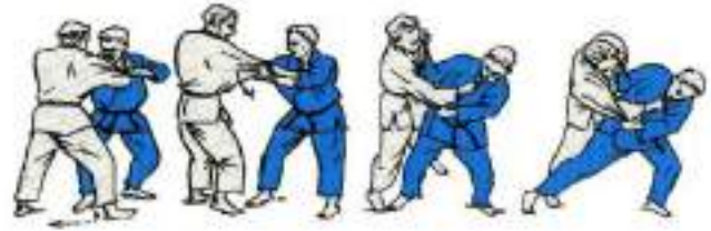
2. Ko-Uchi-Gari Tai-Otoshi