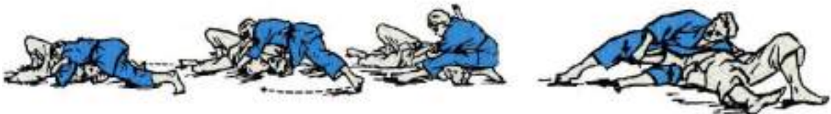
3. Перегіб ліктя захопленням руки під плече та перекриття голови ногою Kuzure-Kame-Shiho-Gatame