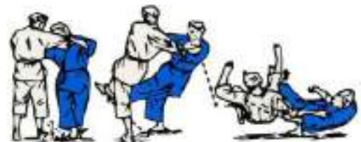
8. Бокова підсічка з падінням Yoko-Gake