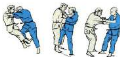
2. Підсічка із середини під п'яту Ko-Uchi-Gari